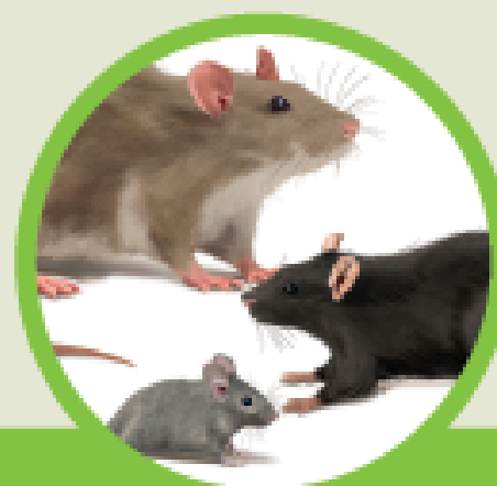
Avistamento de roedores