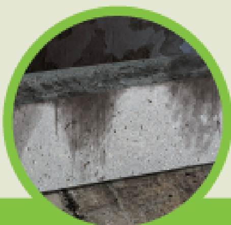
Manchas de gordura

Identifique os sinais de roedores e os principais pontos de passagem e abrigo da praga.